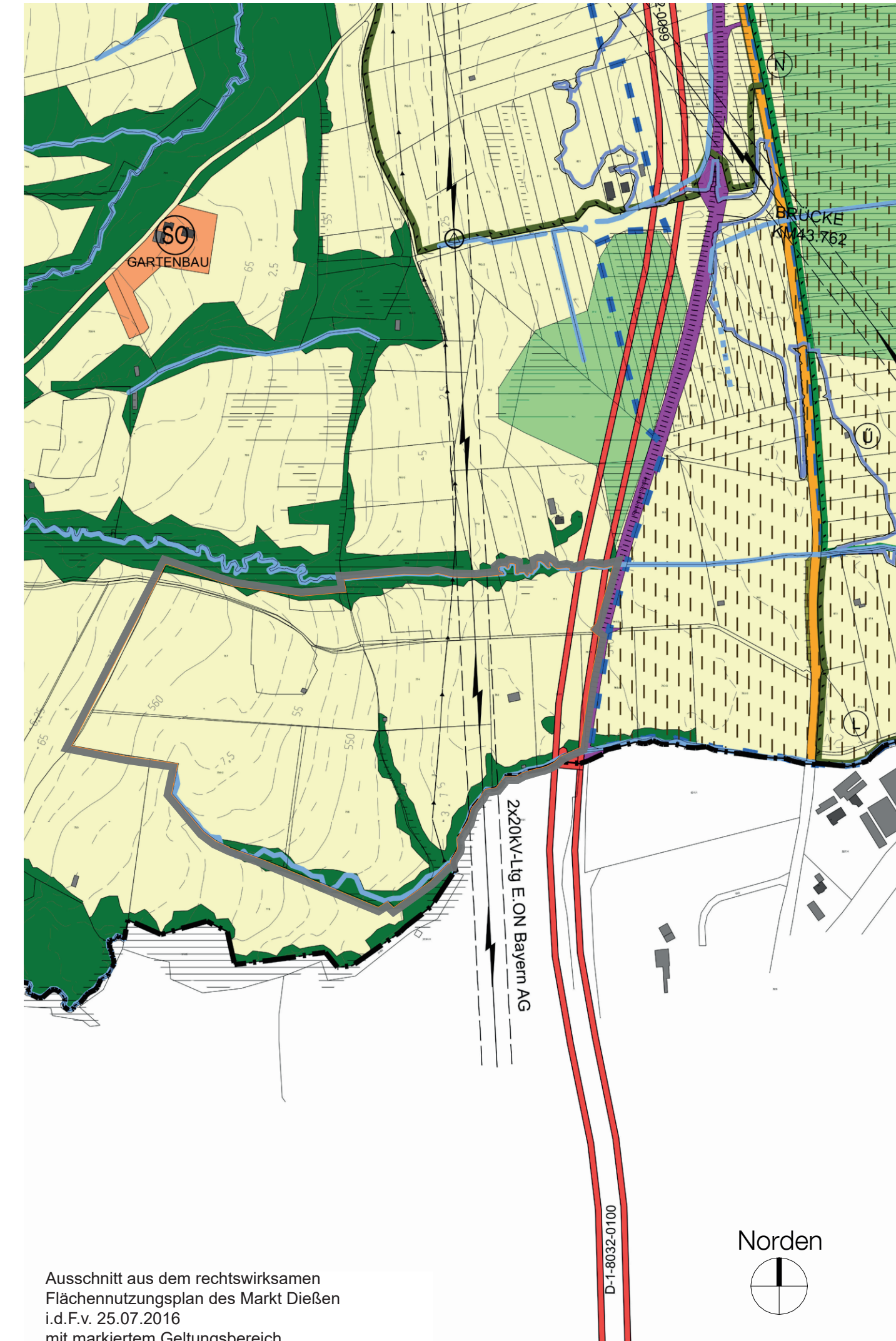
Ausschnitt aus dem rechtswirksamen Flächennutzungsplan des Markt Dießen i.d.F.v. 25.07.2016 mit markiertem Geltungsbereich